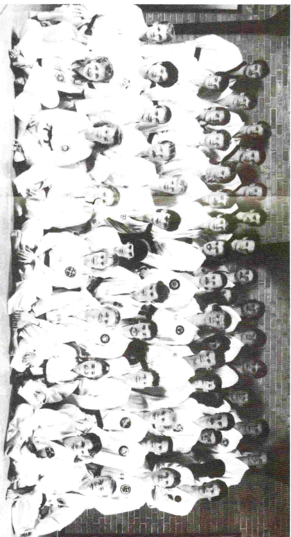
Delegerne ved vinterlejrens dangraduering.