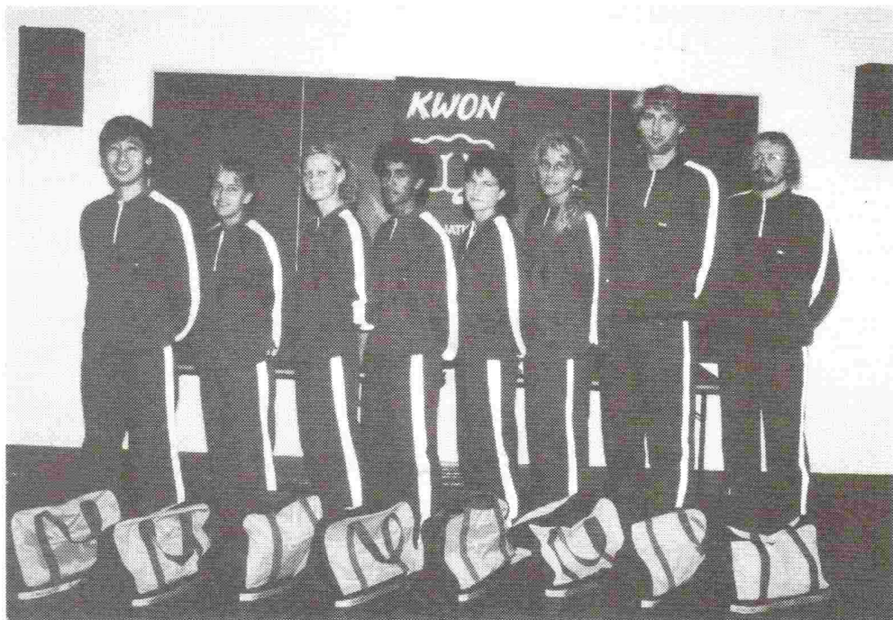
Det danske OL-team på vej til Seoul, Korea