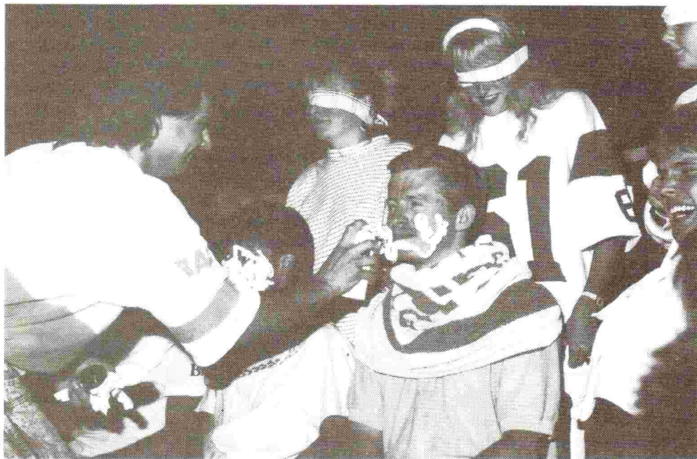
- Der var sjove indslag om aftenen