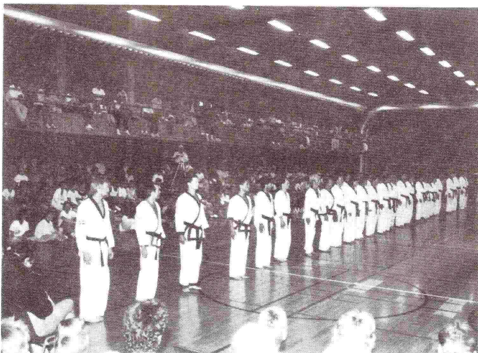
Fra sommerlejrens Gallaopvisning