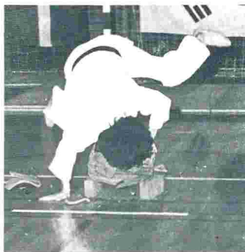
Mr. Lee giver den en skalle, indtil maden er varm.

har måske fået nogen til at blive hjemme, men vi tror og føler, at alle har fået mere ud af denne vinterlejr i forhold til den forrige. Ligeledes mener vi ikke, at der var nogen, der tog hjem med følelsen af, at de havde betalt for meget.