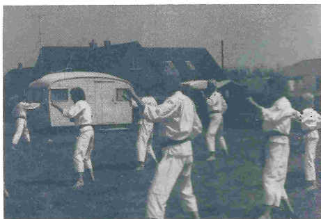
Fra træningen på Fanø.