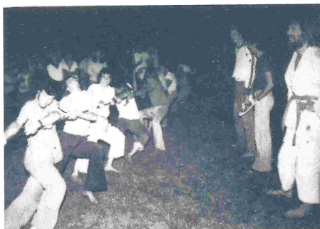
Fra sommerlejren 1976 i Oksbøl. Tovtrækning mellem Esbjerg og ?.

Sommerlejren i Oksbøl blev afholdt til alle deltagende fra Cheong Yongs tilfredshed. F.eks. var teltet som vi havde lejet godt nok forholdsvis dyrt, men det tjente sig selv ind ved den glæde vi havde ved at kunne sidde og spise og snakke sammen. Og i stedet for at gå ned i byen hver aften sad vi og spillede kort, diskuterede osv. (de fleste af os). Et lyspunkt var vores tovtrækning med de forskellige byer, hvor vi godt nok måtte se os besejret af Thisted (trækkerdrengene), men vi mener at have fundet grunden, de havde vist en mand mere med på holdet. Endnu en af lyspunkterne var at vi havde oversvømmelse, lyspunktet var ikke at vi havde oversvømmelse, men at vore telte ikke var oversvømmede.