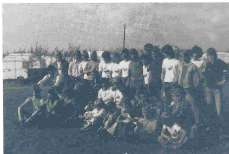
Grubebillede fra Fanø.

Cheong Yong nåede i midten af 1976 så langt at de selv fik trykt deres klubtrøjer. Vi lavede i sommeren 1976 vores egen klubbanner til brug ved alle fællestræninger og lignende. Da bestyrelsen fandt det for bekosteligt hver gang at skulle leje banner af forbundet.